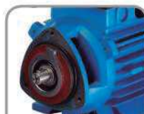
Eje de acero inoxidable